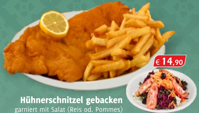
Hühnerschnitzel gebacken € 14,90 garniert mit Salat (Reis od. Pommes) [ A, C, G ]