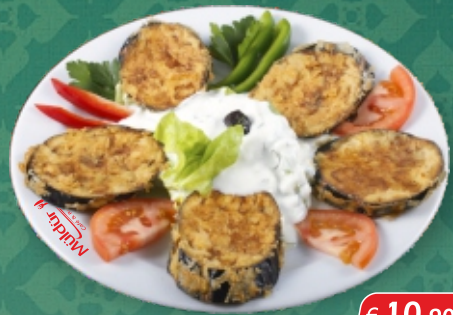
Gebackene Melanzani [ A, C, G ] mit Tsatsiki