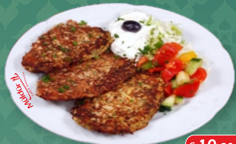
Mücver [ A, C, G ] Zucchini-Käseleibchen und Tsatsiki