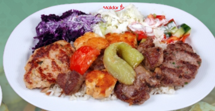
Grillplatte für eine Person € 22,90 garniert mit Salat (Reis od. Pommes) [ A, C, G ]