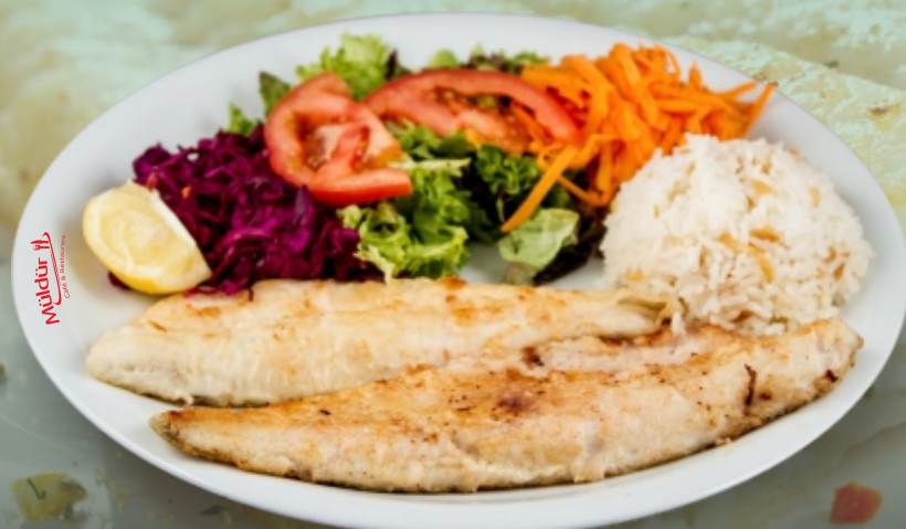
Zanderfilet gegrillt mit Reis od. Pommes und Salat [ C, D, G ]