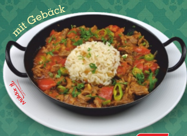
Saç Tava (ET Sote) Geröstetes Lammfleisch mit Reis, garniert mit frischem Gemüse [ C, G ]