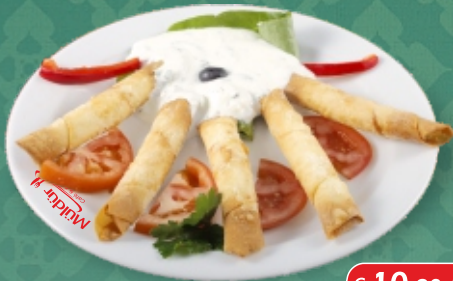
Sigara böregi [ A, C, G ] Blätterteigröllchen gefüllt mit Schafkäse, dazu Tsatsiki