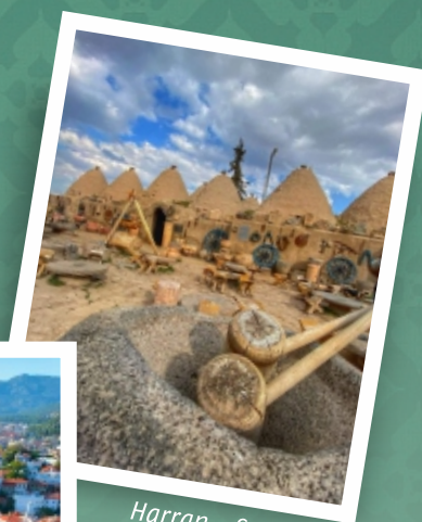
Harran - Sanliurfa