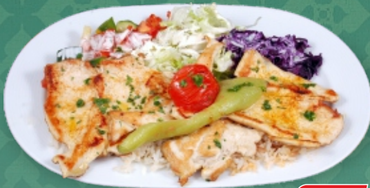
Gegrilltes Hühnerfilet € 14,90 garniert mit Salat (Reis od. Pommes) [ C, G ]