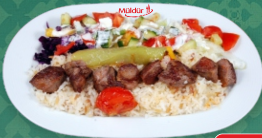
Şiş Kebap / Lammspieß € 17,90 garniert mit Salat (Reis od. Pommes) [ C, G ]