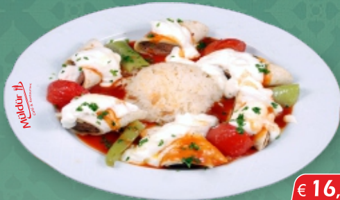
Beyti / Faschierter Lammspieß € 16,90 [ A, C, G ] in anatolischen Fladenbrotröllchen, mit Tomatensauce und Joghurt, mit Reis od. Pommes