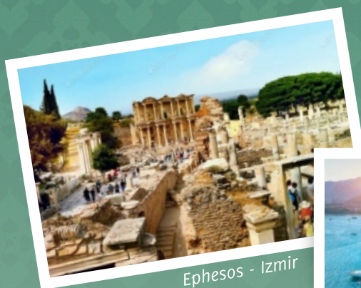
Ephesos - Izmir