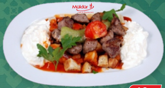
Şiş Kebap / Lammspieß € 18,90 auf Brot mit Tomatensauce u. Joghurt [ A, G ]