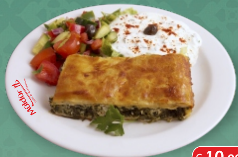
Spinatstrudel mit Tsatsiki [ A, G, C ]