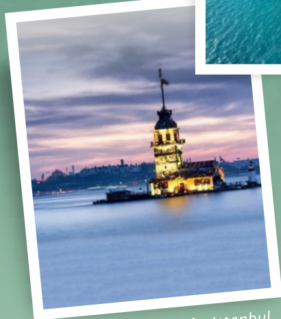
Kiz Kulesi - Istanbul