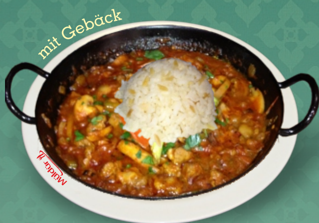
Saç Tava (Sote) Vegetarisch inkl. 1 Portion Reis (Champignons, Tomaten, Zwiebel, Paprika und Petersilie) [ C, G ]