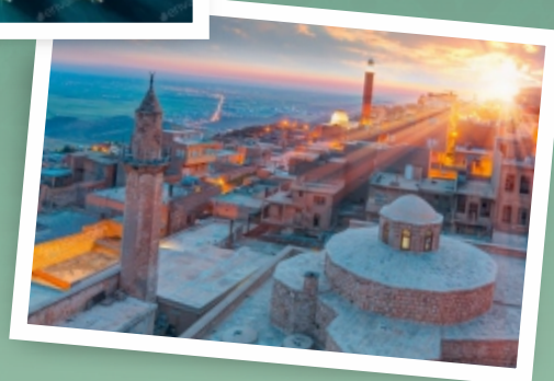
Tarihi kent - Mardin