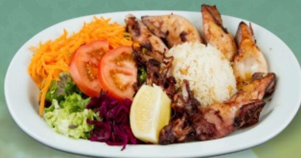
Calamari gegrillt € 16,90 mit Reis od. Pommes und Salat [ C, D ]