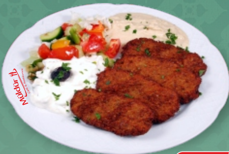
Falafel [ A, C, G, N ] Kichererbsen-Laibchen mit Hummus und Tsatsiki