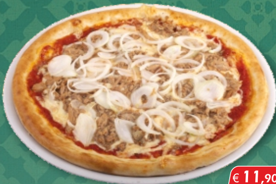
Pizza Al Tonno [A, D, G]