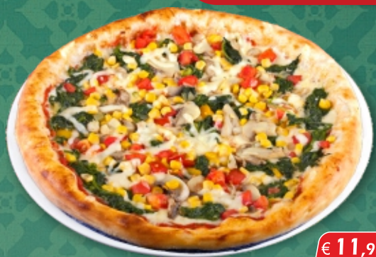
Pizza Vegetaria [A, G]