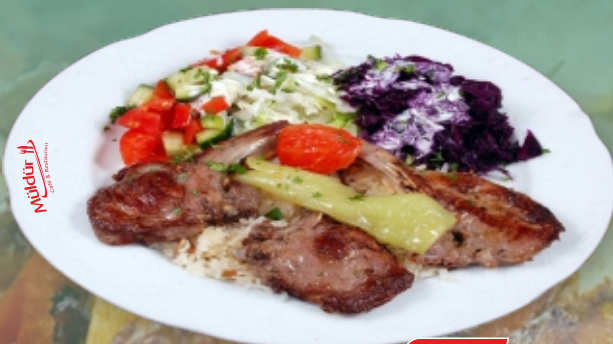
Pirzola / Lammkotelett € 18,90 garniert mit Salat (Reis od. Pommes) [ C, G ]