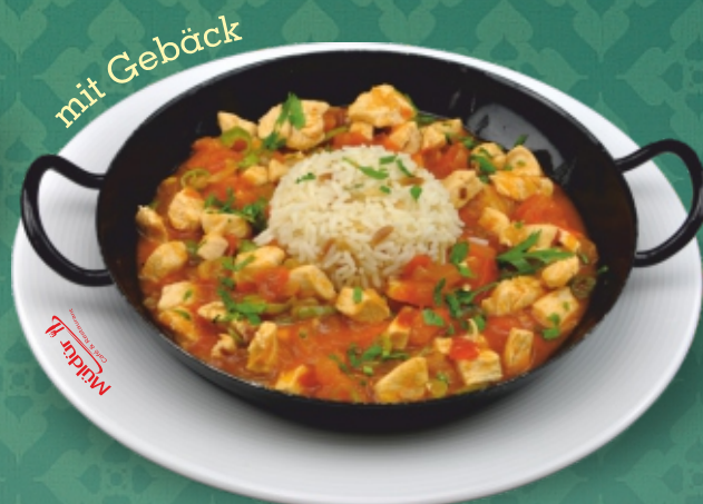
Saç Tava (Tavuk Sote) Geröstetes Hühnerfleisch mit Reis, garniert mit frischem Gemüse [ C, G ]