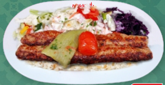
Müldür Kebap € 14,90 Faschierter Hühnerspieß, garniert mit Salat (Reis od. Pommes) [ A, C, G ]